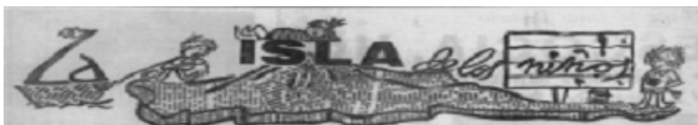
V. Cabecera de la página periodística infantil

Entre 1971 y 1976, vieron la luz un total de 245 números; el número 1 apareció el jueves 1º de abril de 1971 y el último el domingo 2 de mayo de 1976. Había comenzado siendo quincenal hasta el 10 de junio de 1971, cuando la página pasó a ser editada semanalmente, incluida entre las páginas del rotativo El Día. Comenzó los jueves y a partir del 23 de febrero de 1975 pasó a editarse en el Suplemento Dominical del citado periódico. Se mantuvo hasta el domingo 2 de mayo de 1976, fue el último número de un trabajo escolar brillante que pasó a la oscuridad y al silencio.