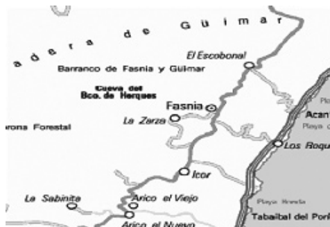
III. Situación del pueblo de la Zarza en el sur de la isla de Tenerife